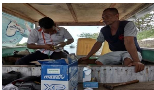
Gambar 6. Pemasangan Baterai dan Kontroler oleh Nelayan dan Tim Pengabdian

Selama pelaksanaan pelatihan para peserta sangat antusias dan tidak ditemukan kendala yang berarti. Para peserta telah dapat mengoperasikan sistem solar cell yang telah terpasang.