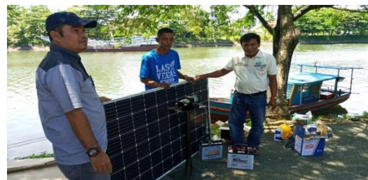
Gambar 4. Serah Terima Peralatan