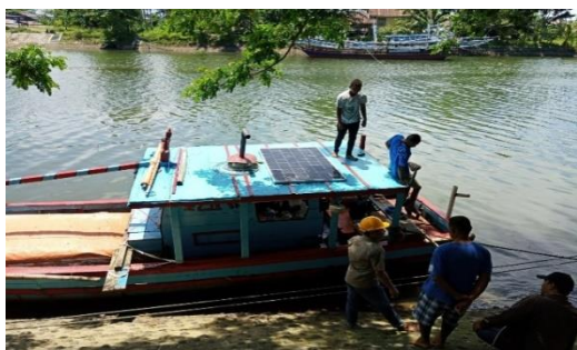
Gambar 5. Pemasangan solar cell di kapal nelayan