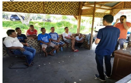
Gambar 3. Pemberian Materi Sumber Energi Baru dan Terbarukan

Berikut ini beberapa dokumentasi kegiatan: