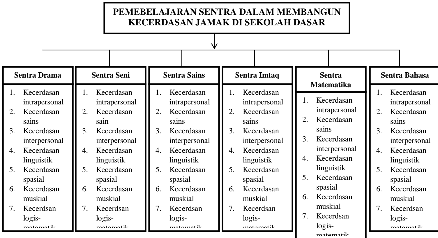
Gambar 1. Bagan Pembelajaran Sentra dalam Membangun Kecerdasan Jamak