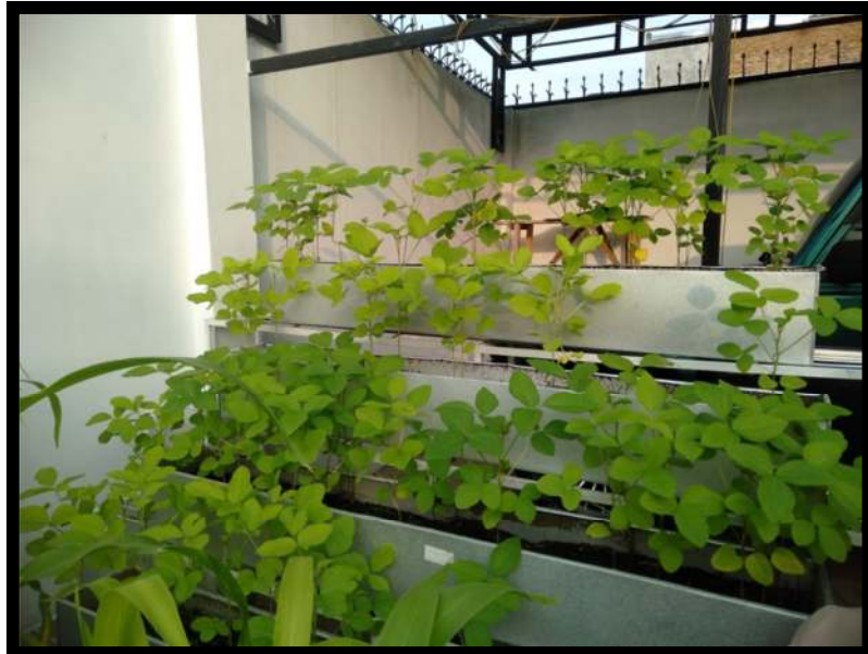
Gambar 3. Tanaman Kedelai Hitam

Tabel 2 Indeks Luas Daun (ILD), Indeks Luas Daun (ILD) merupakan salah satu parameter yang sangat penting di dalam penelitian karena Indeks Luas Daun (ILD) dapat mengidentifikasi produktivitas hasil tanaman tersebut (Hizbi & Ghulamahdi, 2019). Menurut (Gribaldi & Nurlaili, 2019) jarak tanam berpengaruh nyata terhadap jumlah daun dan indeks luas daun terhadap tanaman selada. Kandungan nitrogen fosfor dan magnesium sangat dibutuhkan untuk produktivitas indeks luas daun. Dikarenakan unsur hara tersebut dapat memicu dan membantu proses fotosintesis di dalam daun. Sehingga pengaturan jarak tanam dan dua kultivar kedelai kemungkinan terbesar tidak berpengaruh nyata terhadap pertumbuhan vegetatif kedelai hitam (Surbakti et al., 2015). Berdasarkan tabel 2, hasil analisis ragam pengukuran indeks luas daun menunjukkan bahwa kultivar dan jarak tanam tidak memiliki pengaruh nyata.