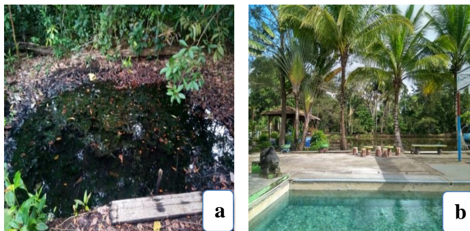
Gambar 1. Sumber Air Panas Non-Vulkanik: (a) Kolam sumber air panas Desa Permis; (b) Air panas yang dialirkan ke kolam pemandian di Desa Pemali

Pengambilan sampel air panas dilakukan di dua lokasi berbeda, yaitu Permis dan Pemali. Sumber air panas Permis berlokasi di Kecamatan Simpang Rimba, Kabupaten Bangka Selatan, sedangkan sumber air panas Pemali berlokasi di Kecamatan Sungailiat, Kabupaten Bangka. Secara umum, sumber air panas pada kedua lokasi berupa sumur atau kolam kecil pada permukaan tanah (Gambar 1). Air panas yang berasal dari kolam tersebut kemudian dialirkan ke kolam yang lebih besar untuk keperluan pemandian umum. Berikut ini ditampilkan karakteristik mikroklimat lokasi pengambilan kedua sampel tersebut: