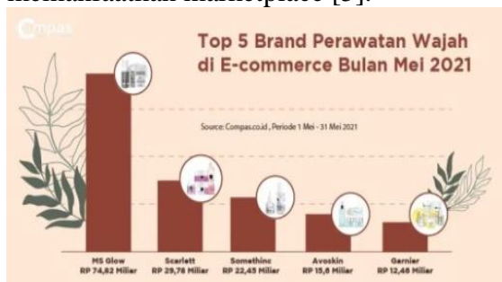
Gambar 1. top 5 Brand Perawatan Wajah di E – Commerce

muda Indonesia. Diantaranya prestasi ini pernah ikut Paris Fashion Week pada bulan february 2022 [4]. Diketahui pada data ini jika skincare ini ialah produk perawatan wajah lokal yang bisa mendapatkan kedudukan kedua di top 5 brand perawatan wajah di e-commerce yang menawarkan bermacam produk skincare dengan online dengan memanfaatkan marketplace [5].