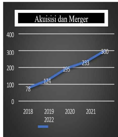
Gambar 1. 1 Jumlah Notifikasi Merger dan Akuisisi Indonesia (2018-2022)

kinerja dan nilai perusahaan dalam jangka panjang.