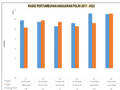
Gambar 1. Rasio Pertumbuhan Anggaran Polri 2017 - 2022