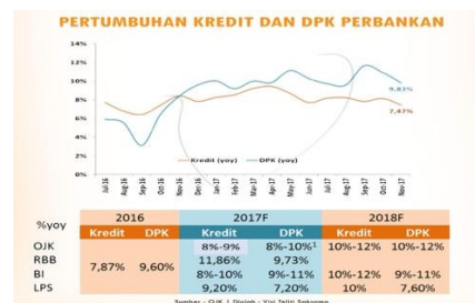
Gambar 2. Pertumbuhan Kredit dan Dana Pihak Ketiga (DPK) Perbankan di Indonesia 2017

Gambar 1 menunjukkan jumlah pertumbuhan ekonomi di Indonesia dari tahun 2010 tahun sampai dengan 2017 dimana dari tahun 2010 sampai dengan tahun 2015, jumlah pertumbuhan ekonomi di Indonesia cenderung mengalami penurunan. Namun, sejak 3 (tiga) tahun terakhir, dari tahun 2015 sampai dengan tahun 2017 jumlah pertumbuhan ekonomi di Indonesia selalu mengalami kenaikan. Hal ini menunjukkan perkembangan perekonomian negara Indonesia ke arah yang positif.