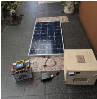
Gambar 3. Alat Penetas Telur Tenaga Surya