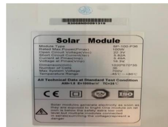
Gambar 2. Spesifikasi Panel Surya Max.Voltage (Vmp) : 17.6V Max.Current (Imp) : 5.75A Open Circuit Voltage ( Voc ) : 22.4V Short Circuit Current ( Isc ) : 6.08 A Maximum Power at STC ( Pmax) : 100W Maximum System Voltage : DC 700V Cells type : mono Dimension : 1020 x 670 x 35mm