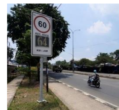
Gambar 3. Peningkat Kecepatan

a. Pengendalian Kecepatan: Sistem pengendalian kecepatan otomatis dapat memperingatkan pengemudi atau secara otomatis mengatur kecepatan kendaraan untuk memastikan kepatuhan terhadap batas kecepatan (Kim, S., & Park, J. 2019).