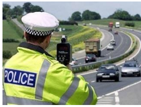
Gambar 4. Speed gun radar