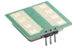
Gambar 2. Sensor Doppler

digunakan (Smith, J., & White, R. 2018).