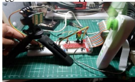
Gambar 5. Pengujian Speed Detector

Pengembangan prototyping speed detector radar dengan menggunakan raspberry pi dan Arduino nano ini merupakan tahapan dari migrasi yang direncanakan pada sistem yang sedang dikembangkan. Pemanfaatan 2 (dua) jenis IoT (Raspberry Pi dan Arduino) dan menggunakan sensor doppler (CDM324).