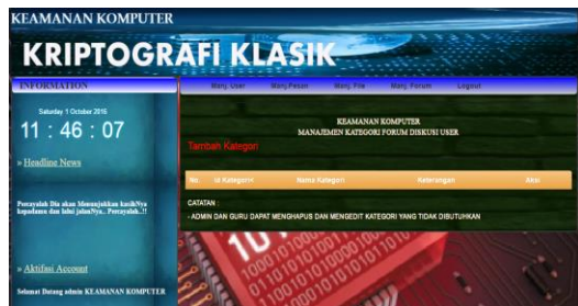
Gambar 6. Halaman Forum

Gambar 6 merupakan halaman forum yang merupakan salah satu tempat belajar atau saling bertanya antar sesama user yang terdiri dari submenu kategori, diskusi, topik dan komentar.