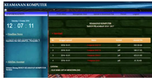
Gambar 8. Halaman Download