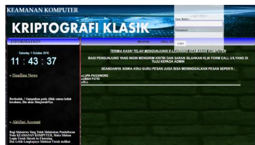
Gambar 4. Halaman Login

Gambar 4 adalah halaman login dimana user memasukkan username dan password agar dapat mengakses menu utama. Untuk pendaftaran tidak dapat dilakukan secara manual.