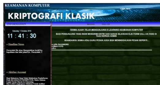
Gambar 3. Halaman Utama Gambar 3 merupakan halaman utama pada web.