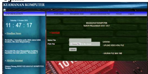
Gambar 7. Halaman Upload