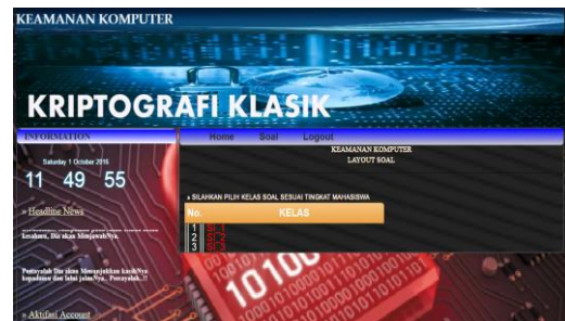
Gambar 9. Halaman Ujian

Pada halaman download dan upload terdapat pada menu masing-masing user yaitu dosen mahasiswa. Dosen dapat melakukan update materi pelajaran dengan cara upload materi pelajaran pada sistem yang kemudian mahasiswa dapat melakukan download materi pelajaran tersebut untuk dipelajari. Mahasiswa dapat melakukan upload tugas yang diberikan oleh dosen yang kemudian dosen dapat melakukan download tugas tersebut untuk kemudian dinilai.