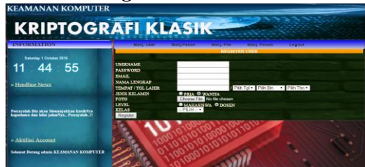
Gambar 5. Halaman Register User

Gambar 5 merupakan halaman register user yang terdiri dari username , password , e-mail , nama lengkap, tempat / tanggal lahir, jenis kelamin, foto, level dan kelas yang mana halaman di isi oleh masing-masing user yang akan mendaftar sebagai user baik mahasiswa maupun dosen.