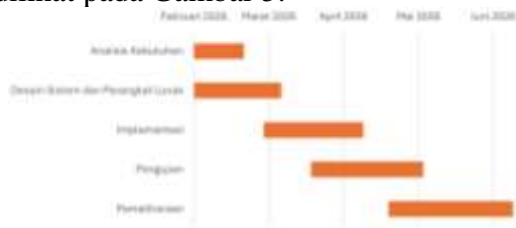
Gambar 5. Gantt Chart Implementasi Sistem dan Jadwal

Tahap implementasi dilakukan pada bulan Maret hingga April 2026, menggunakan framework Laravel untuk backend dan React untuk frontend, dengan MySQL sebagai basis data. Sistem di-hosting pada Virtual Private Server (VPS) berbasis Linux sehingga dapat diakses melalui browser tanpa instalasi lokal. Jadwal implementasi selengkapnya dapat dilihat pada Gambar 5.