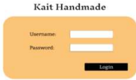
Gambar 4. Contoh User Interface Design