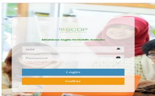
Gambar. 3 Tampilan Halaman Login