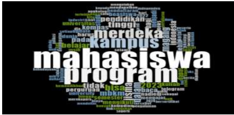
Gambar 1. Hasil pengolahan Word Cloud

Berdasarkan hasil word cloud di atas frekuensi kata yang sering muncul adalah magang, kemudian frekuensi kata yang sering muncul kedua ada MBKM, Universitas, Nadiem, industri, dan juga kebijakan. Dari hasil word cloud tersebut menunjukkan frekuensi kata magang merupakan frekuensi kata yang sering ada di media massa yang menjadi sumber data. Dari hasil tersebut bisa di simpulkan bahwa frekuensi kata magang menjadi topik yang paling banyak dibahas dan dicari oleh orang-orang.