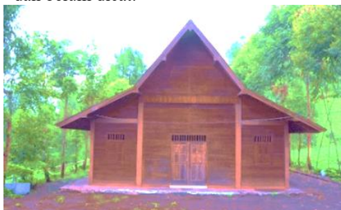
Gambar 3. Rumah Tengger

Suku Tengger adalah suku asli yang tinggal di lereng Gunung Bromo. Gambar 3 berikut menunjukkan Rumah Tengger milik Bu Anggun yang memiliki bentuk simetris dan belum dicat.