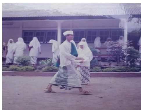
Gambar 3. Kesetaraan dalam hak pendidikan

Sebagai pelaku sejarah Pergerakan Kebangsaan, Hamzanwadi adalah agen (thinker and story teller). Pemikiran yang menjadi ide dasar didirikannya NW tidak lain adalah kesadaran tugas dan tanggung jawab manusia sebagai pemimpin di muka bumi, sebagaimana diajarkan agama Islam. Sebagai thinker dan story teller , Hamzanwadi memahami tidak semua orang tertindas menyadari ketertindasannya, bahkan kadang-kadang menganggapnya sebagai sesuatu yang taken for granted .