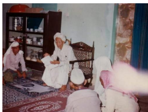
Gambar 2. Tradisi Pesantren dalam pendidikan Indonesia

pandangan mendasar tentang manusia. Salah satunya tersebut dalam QS. adz-Dzaariyaat , 56: “Dan tidaklah Aku ciptakan Jin dan Manusia kecuali untuk beribada kepadaku”. Secara etnografis ayat ini menunjuk pada realitas bahwa semua manusia (tanpa menyebut Jin) adalah sama, yakni bertanggung jawab untuk beribadah kepada-Nya melalui praktek-praktek ketakwaan. Kesamaan tanggung jawab ini menunjuk pada kesamaan status di mata sesama ( hablumminannaas ). Intinya, kurikulum pendidikan di Madrasah ash-Shaulatiyah secara langsung maupun tidak langsung menyampaikan substansi kesetaraan, kesejajaran, dan kesamaan hak dan tanggung jawab manusia terhadap Tuhan.