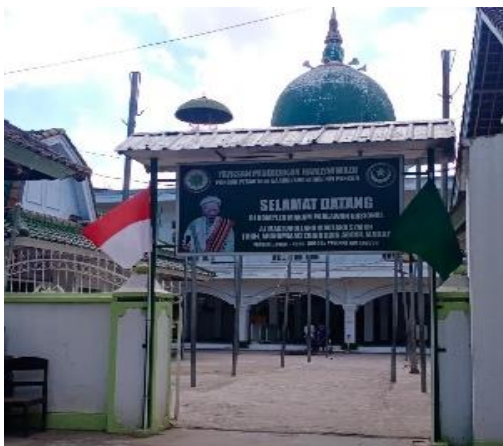
Gambar 6. Situs Makam Pahlawan Nasional TGKH Muhammad Zainuddin Abdul Madjid

Pendidikan yang diinisiasi dan diinstitusionalisasi oleh Hamzanwadi adalah pendidikan dari dan oleh rakyat. Kehadiran awalnya sebagai khazanah individual yang dihajatkan sebagai instrumen penyadaran tentang kondisi kontekstual masyarakat pada masanya. Seluruh dokumen kebangsaan menyebutkan bahwa agenda pembangunan termasuk pendidikan bertujuan untuk kesejahteraan masyarakat Indonesia. Masyarakat Indonesia tidak dibatasi dengan entitas etnografis dan sosialnya. Karena itu, kehadiran NWDI sebagai lembaga pendidikan awal yang diperuntukkan bagi kaum pria dianggap belum memenuhi rasa keadilan untuk kemanusiaan melalui pendidikan. kehadiran NBDI menjadi jawaban atas kebutuhan pendidikan bagi kaum wanita untuk memenuhi hak-haknya atas kesejahteraan melalui pendidikan. kehadiran NBDI adalah kesadaran universal tentang kesetaraan hak atas pendidikan bagi sesame, sehingga masing-masing dapat berkiprah dalam menjalankan tanggung jawab sejarah menuju kesejahteraan bersama sebagai tanggung jawab kebangsaan secara dinamis.