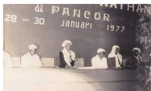
Gambar 5. Konteks konsolidasi

1970-an. Peristiwa sejarah era kemerdekaan ini menunjukkan adanya hubungan antara tanggung jawab penyediaan fasilitas pendidikan untuk kaum perempuan sebagai hak dasar kemanusiaannya sebagaimana ketentuan agama Islam). Juga menunjukkan sudah muncul pikiran futuristik bahwa kesetaraan antara peran gender antara laki-laki dan perempuan menjadi strategis dalam perjalanan sejarah peradaban kebangsaan di masa depan.