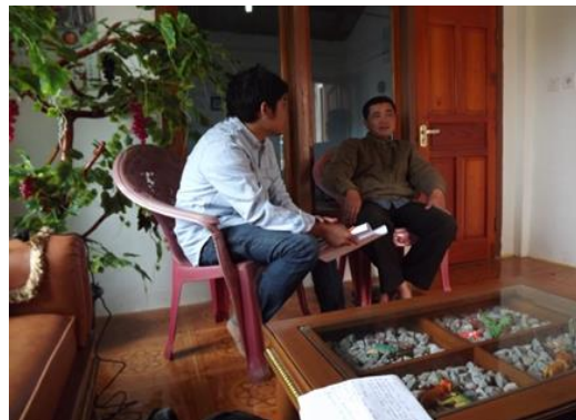
Gambar 2. Kepala Desa Pesisir Bukit

bermata pencarian sebagai petani pada waktu itu masih pulang pergi dan belum menetap pada daerah pertanian mereka, karena mereka memiliki rumah yang jauh dari areal pertanian. Sehingga masyarakat pada saat itu belum menetap. Masyarakat di Kecamatan Gunung Tujuh menganggap bahwa mata pencarian petani merupakan penopang dalam pemenuhan kebutuhan hidupnya semenjak turun temurun dari orang tua mereka, sehingga apabila masyarakat tersebut di gusur dari lahan pertanian mereka berharap pemerintah menyediakan lahan lainnya sebagai ganti ladang mereka. Masyarakat pun bersedia pindah dari lokasi mereka sekarang apabila pemerintah menyediakan lahan ganti bagi ladang mereka. Berikut di bawah ini merupakan dokumentasi wawancara peneliti pada saat di lapangan.