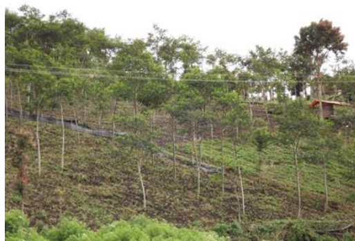
Gambar 3. Lahan Pertanian

Untuk lebih jelasnya kegiatan yang dilakukan masyarakat dapat dilihat melalui dokumentasi peneliti di bawah ini.