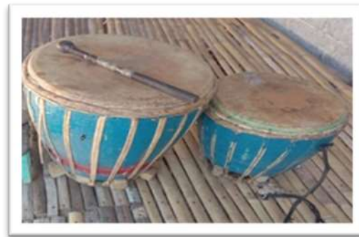
Gambar 2. Rebana Gong dan Pemoto'

Bentuk dan ukuran Rebana Lima berbeda dengan alat mujsik Rebana pada umumnya. Alat ini berbentuk lebih mirip dengan alat musik Gendang satu sisi dengan ketebalan kerangka yang lebih besar dibandingkan dengan rebana biasa. Contoh gambar dapat dilihat pada gambar 2 berikut.