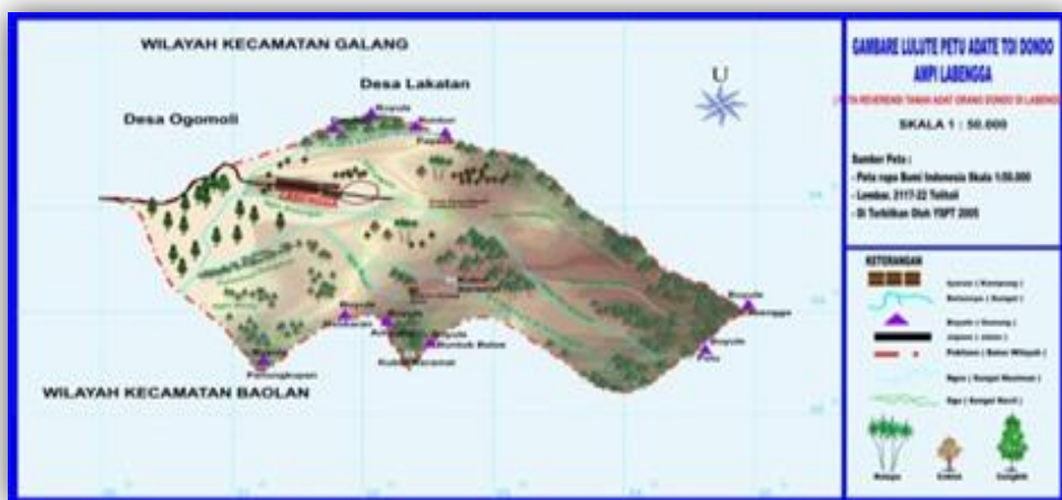
Gambar 1. Lokasi Desa Labengga

Lokasi di Desa Labengga, Kecamatan Galang, Kabupaten Tolitoli. Pemilihan lokasi ini di dasarkan pada potensi alam yang terdapat pada lokasi tersebut. Jarak dari ibu kota Kecamatan Galang 17 km, dengan kondisi jalan aspal, dan ditempuh baik kendaraan umum berupa roda empat dan roda dua. Desa Labengga merupakan salah satu bagian dari wilayah konservasi lingkungan. Letak Desa Labengga tersebut berdekatan dengan Desa Ogomolli dan Desa Lakatan, di mana secara administrasi berada di wilayah Kecamatan Galang Kabupaten Tolitoli, dan dapat di tempuh selama \pm 1 jam dari Kota Tolitoli. Waktu penelitian selama tiga bulan yaitu pada bulan Juli s/d September 2020.