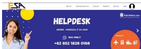
Gambar 1. Pabrik Tiket

Melakukan pelayanan dengan menyapa, menyambut tamu, atau yang biasa disebut dengan greeting. Menangani tugas sebagai memesan tiket kereta, tiket pesawat, tiket travel serta hotel. Membuatkan nota atau invoice serta voucher hotel untuk diberikan kepada pembeli sebagai bukti transaksi.