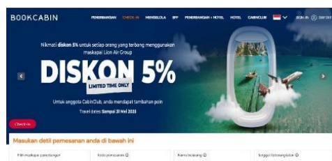
Gambar 5. Web Book Cabin