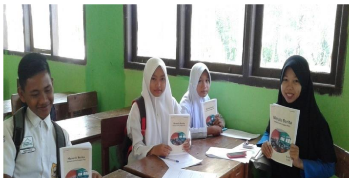
Gambar 1 Uji coba prototipe (foto Bersama Setelah Uji Coba Prototipe)

Evaluasi prototipe dilaksanakan pada hari senin tanggal 15 Mei 2017 di SMP Negeri Sumber Rejo, dengan melakukan wawancara kepada tiga orang siswa dari kelas VIII.1. Pelaksanaan uji coba prototipe dilakukan pada tiga siswa yang menyatakan penampilan keseluruhan model bahan ajar menarik, bagus, dan mewah. Isi materi yang disajikan lengkap, mudah dipahami, bahasa yang digunakan juga mudah dipahami. Gambar sesuai dengan isi materi, warna yang digunakan sesuai, netral, sangat menarik, dan bagus. Tingkat kesulitan materi mudah dipahami dan dicerna karena lengkap, disertai dengan pendapat ahli. Ketiga siswa menyukai ukuran buku yang kecil karena lebih praktis dan mudah dibawa. Sedangkan jenis huruf yang digunakan ketiga siswa memilih huruf arial karena tulisannya besar-besar sehingga mudah untuk di baca. Berikut ini merupakan kegiatan pelaksanaan kegiatan uji coba prototipe yang disajikan pada gambar di bawah ini