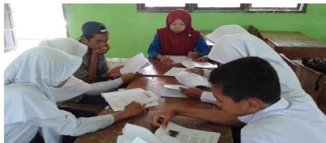
Gambar 2 Peserta Didik Memahami Materi Menulis Berita Pada Model Bahan Ajar

Hasil sikap siswa pada evaluasi kelompok kecil dapat dilihat pada penilaian angket kelompok kecil sebagai berikut: