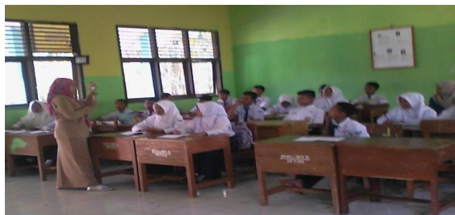
Gambar 3 Guru Menjelaskan Materi Menulis Berita

Berikut ini hasil angket respon siswa terhadap model bahan ajar menulis berita berbasis koran Linggau Pos :